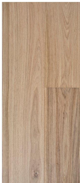
Eg Prime børstet hvid Varenr.: 145091ns DB nr.: 2307347