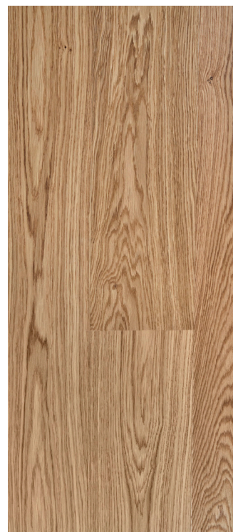
Eg Prime børstet natur Varenr.: 145092ns DB nr.: 2313060