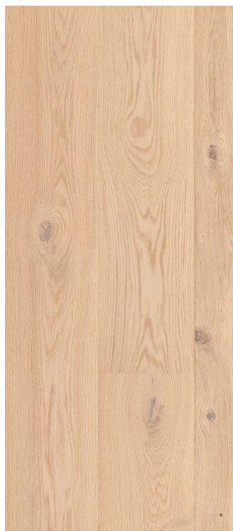
Eg Country børstet hvid Varenr.: 145084s DB nr.: 2313057