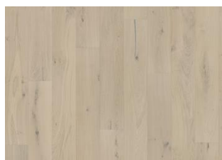
Loft White Plank