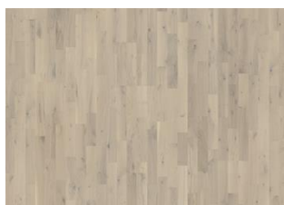
Loft White Strip