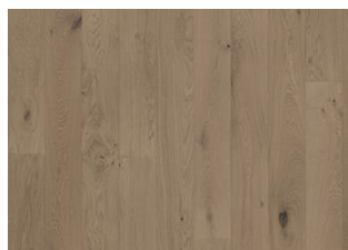
Frozen Hazelnut Plank