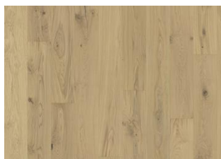
Eg Urban Brown Plank