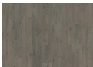
Pearl Grey Strip