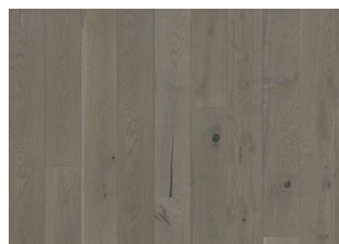
Pearl Grey Plank