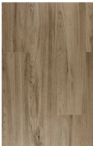
Quartz Oak Varenr.: FDYM001 DB nr.: 2166526