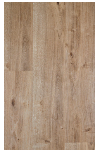
Field Oak Varenr.: FDYG001 DB nr.: 2135428