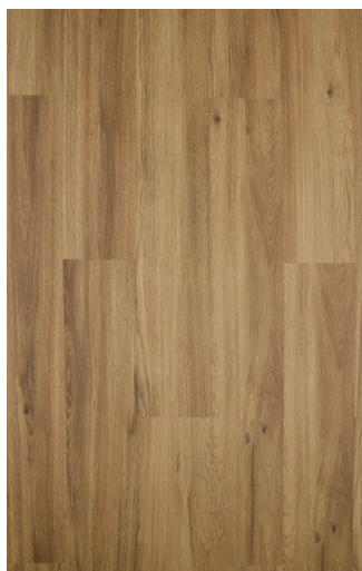
Mocca Oak Varenr.: 80001623 DB nr.: 2274108