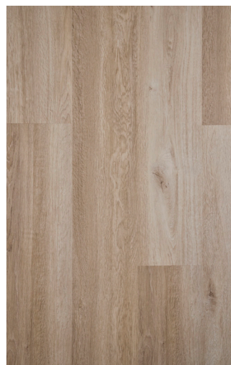
Ocean Oak Varenr.: FDYF001 DB nr.: 2135427