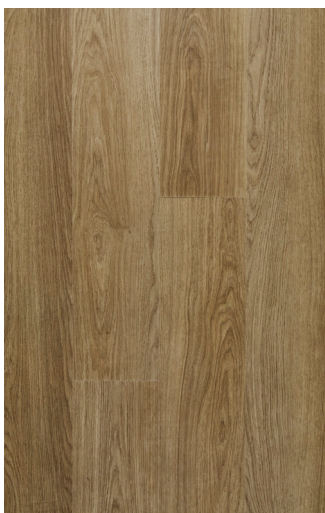
Manor Oak Varenr.: FDYE001 DB nr.: 2135426