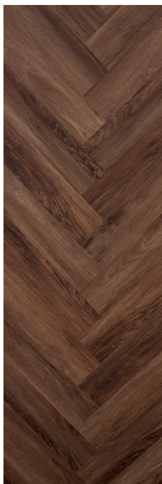
Sildeben Smoked Oak Varenr.: 155002 DB nr.: 2257896