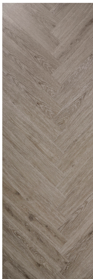
Sildeben Steel Oak Varenr.: 155009 DB nr.: 2133609