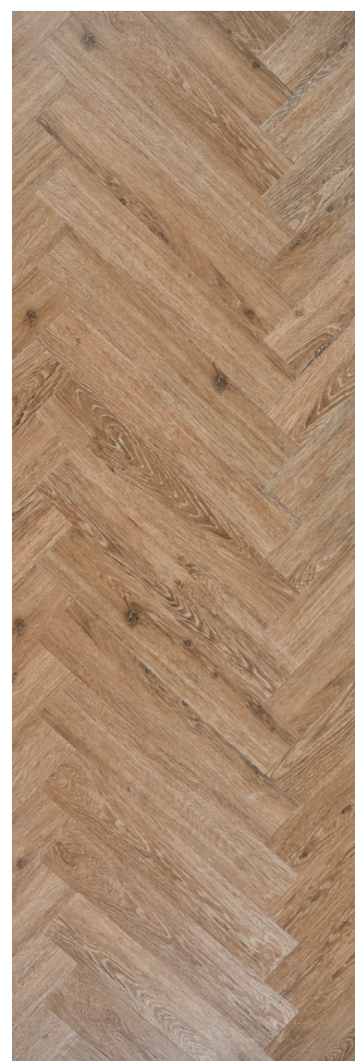
Sildeben Natural Oak Varenr.: 155014 DB nr.: 2085470